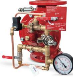
77DE-EL-MR Manuel Reset

Belgelendirme çalışmaları devam etmektedir.