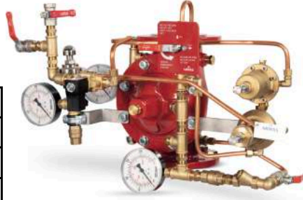
77DE-EL-PORV-PR-MR Manuel Reset