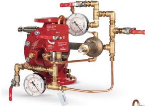
77DE-HRV-MR Manuel Reset

Belgelendirme çalışmaları devam etmektedir.