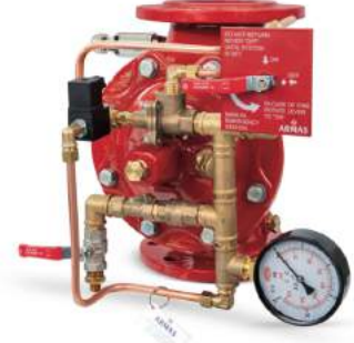
77DE-EL-RR Remote Reset