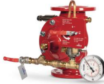
77DE-HM-MR Manuel Reset

Belgelendirme çalışmaları devam etmektedir.