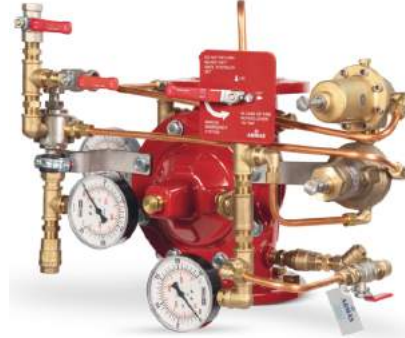
77DE-PORV-PR-MR Manuel Reset

Belgelendirme çalışmaları devam etmektedir.