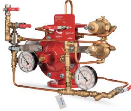
77DE-HRV-PR-MR Manuel Reset

Belgelendirme çalışmaları devam etmektedir.