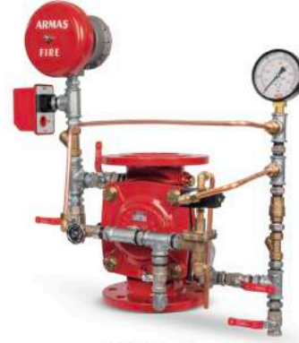
67DE-EL-AL Full Trim Set