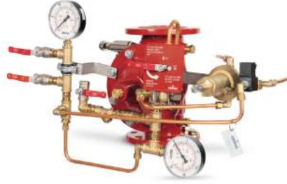
77DE-EL-HRV-MR Manuel Reset

Belgelendirme çalışmaları devam etmektedir.