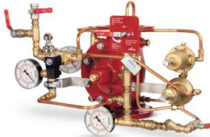
77DE-EL-HRV-PR-MR Manuel Reset

Belgelendirme çalışmaları devam etmektedir.