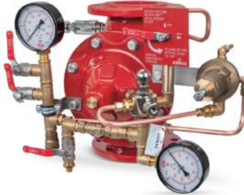
77DE-PN-MR Manuel Reset

Belgelendirme çalışmaları devam etmektedir.