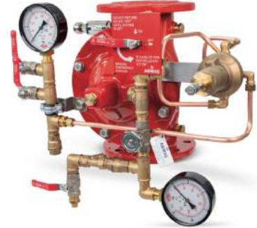
77DE-PN-RR Remote Reset