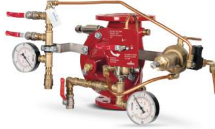
77DE-EL-PORV-MR Manuel Reset

Belgelendirme çalışmalarını devam ettirmektedir.